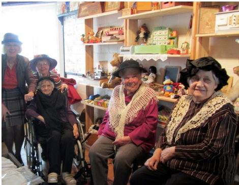
Fotowettbewerb Lichte Momente - Alzheimer Gesellschaft SH