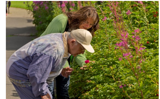
Fotowettbewerb Lichte Momente - Alzheimer Gesellschaft SH